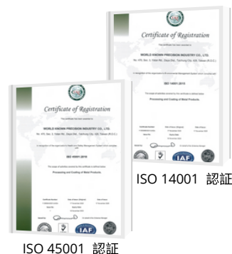
ISO 45001 認証

WKPTは、ISO14001環境管理システムおよびISO45001労働安全衛生管理システムの認証を取得した。WKPTは「安全、品質、誠実、協力、責任」というコアバリューを持つ、環境保護と労働安全を重視し、国際基準に合わせて、慎重な会社経営を実践する。法律強制規定の有無にも関わらず、活性炭設備の導入により塗料・塗装からの大気汚染を防止することや、廃切削液処理設備の導入により加工後の切削液廃水の排出量を75%削減することなど、WKPTはさまざまなリソースを投資して継続的に改善活動を実施している。会社が着実に成長を遂げる同時に、地球を保護しながら会社を永續させることを目指す。