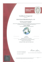
IATF 16949 認証

WORLD KNOWN PRECISION INDUSTRY CO., LTD.