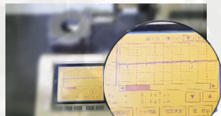
表粗量測 Ra 0.187 μm

鑄鐵件因為石墨組織問題，加工面粗糙度控制遠較碳鋼或合金鋼困難。光隆精工已量產球墨鑄鐵加工件達粗糙度 Ra 0.2μm 以下，完成品達到超光面的要求。在我們規劃的加工工序下，克服鑄鐵基地組織的特性—金屬與石墨的交錯排列造成的毛細孔，已可穩定達成 Ra 0.2μm 以下，滿足客戶量產要求。