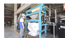
汙泥壓濾式脫水機