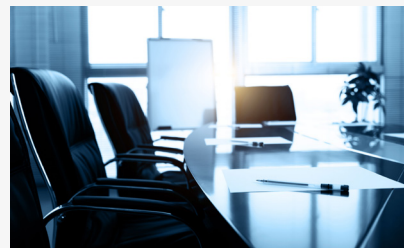
光隆精密集團獲 2023 年公司治理評鑑前 20% 的肯定

市櫃公司治理表現。在企業社會責任層面，公司保持與利害關係人的順暢溝通管道；通過 ISO14001 環境衛生管理認證，同時規定所有供應商須通過評鑑；通過 ISO45001 職業安全衛生管理認證，定期實施員工健檢與職安衛教育，並要求承攬商具備作業資格證書。透過以上行動，公司在日常營運實踐企業社會責任，以永續經營回饋社會。